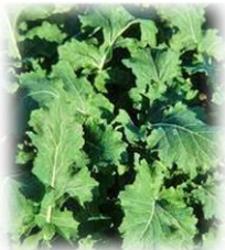
Feuille de colza

A ne pas confondre avec le colza ou la moutarde.